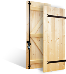
VOLETS BATTANTS 27mm "CORDES" en BOIS EN SAVOIR PLUS