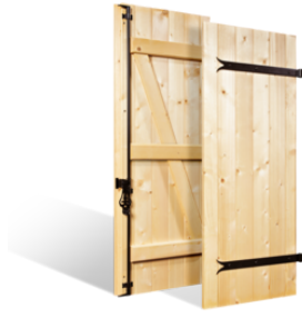
VOLETS BATTANTS 32mm "SAUMUR" à ÉCHARPE CONTINUE en BOIS EN SAVOIR PLUS