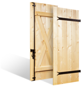
VOLETS BATTANTS 27mm "AUXERRE" à ÉCHARPES CROISÉES en BOIS EN SAVOIR PLUS